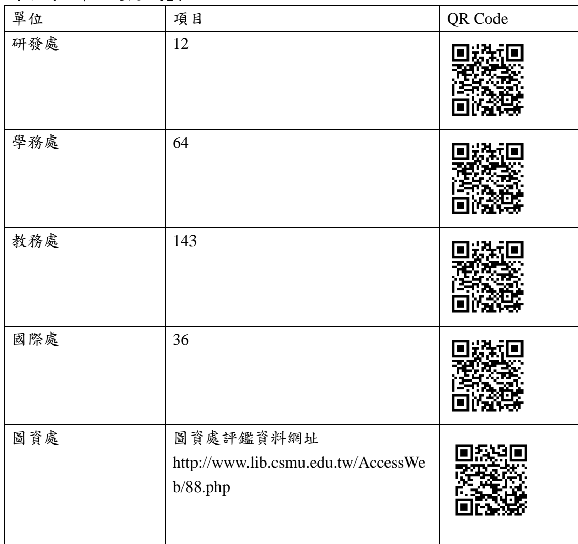
學校行政單位支援一覽表